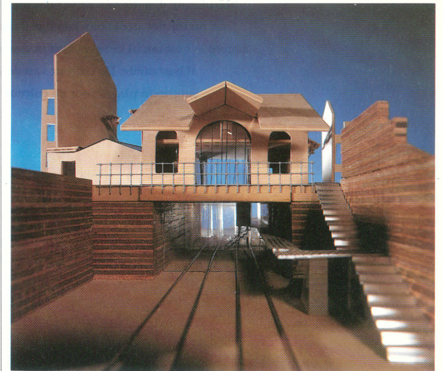
Voorziening voor daklozen, ontworpen door Emiel Lamers (eerste prijs).